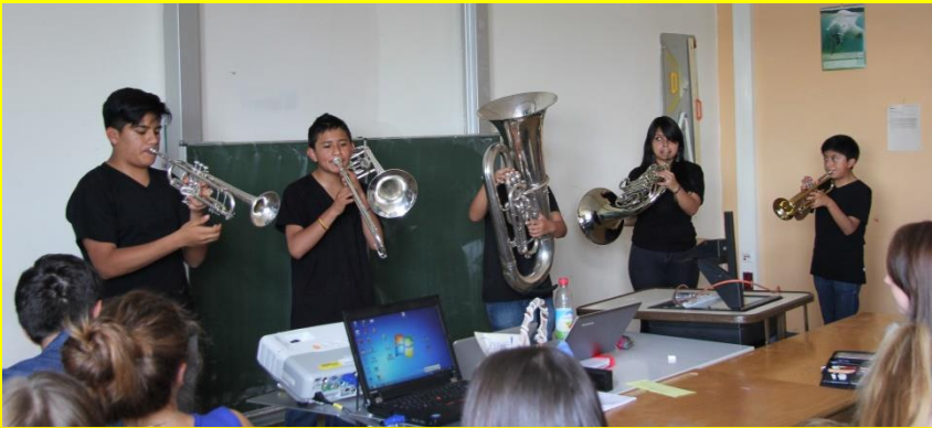
Die BrassBanda del Ecuador